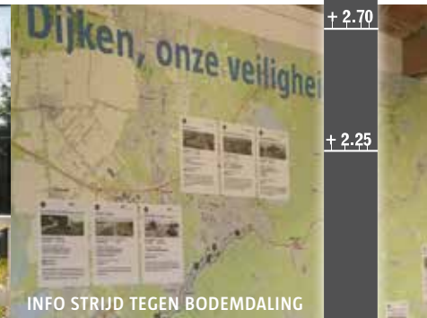
GEVAAR VAN EEN UITGEDROOGDE DIJK