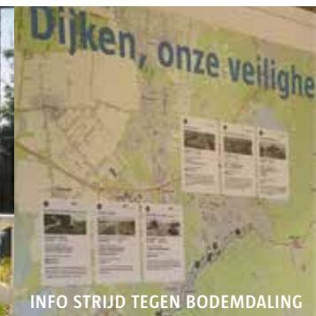
GEVAAR VAN EEN UITGEDROOGDE DIJK